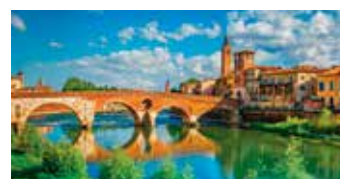
Verona tunnetaan Shakespearen Romeon ja Julian rakkaustarinasta