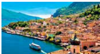
Kristallinkirkas vesi ja järven ympärillä kohoavat upeat vuoret