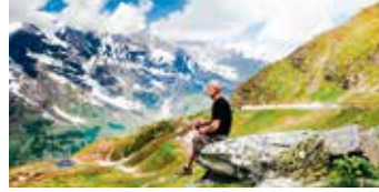
Patikkamatka soveltuu kaikenikäisille hyvän peruskunnon omaaville.