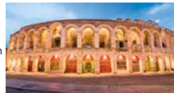
Veronan oopperajuhlall esitetään historiallisessa roomalaisessa amfiteatterissa

20.8.-25.8. Aidan vuoden 1913-näytös 1688€