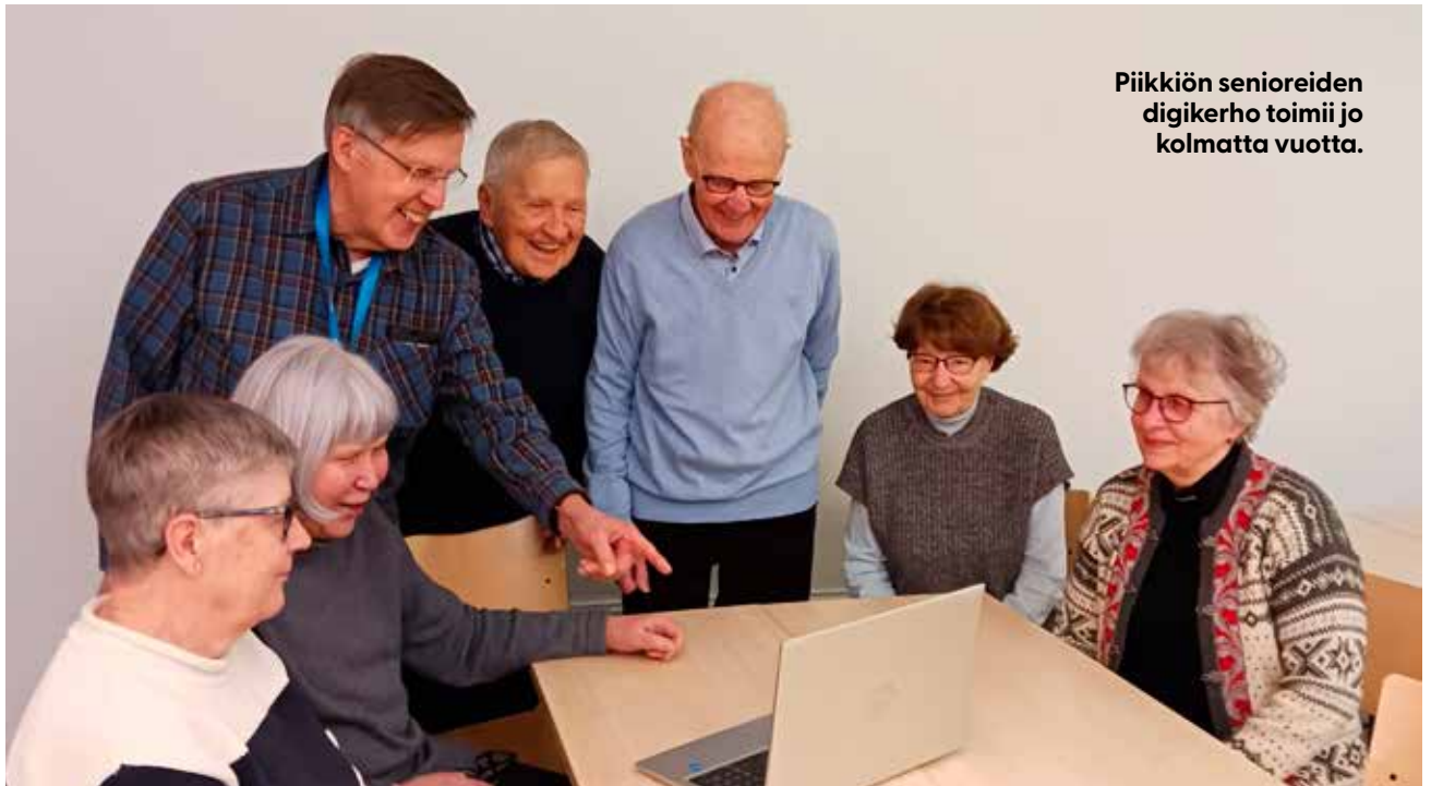
Piikkiön senioreiden digikerho toimii jo kolmatta vuotta.