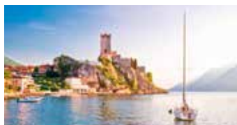
Pohjois-Italian kauneimmat maisemat löytyvät Gardajärven ympäriltä