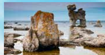
Maaginen saari Färö kiehtoo ja on täynnä kokemuksia