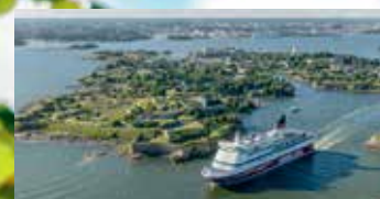
Visbyyn matkataan upean Viking Gabriellan matkassa