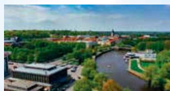
Mahdollisuus nauttia lisämaksusta Dangerous Liaisons baletista