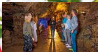
Gotlannin suosituin nähtävyys on historiallinen Lummelundan luola