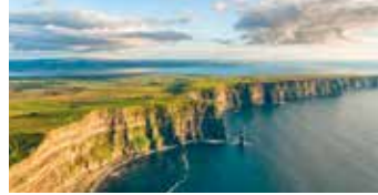
Moherin kalliot ovat yksi Irlannin matkan huippukohdista.