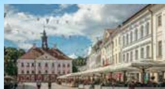
Kaupungin sydän on idyllinen Raatihuoneen tori