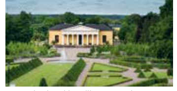
Uppsalan kasvitieteellinen puutarha.

Senioriliiton matkoilla mukana Senioriliiton edustaja ja suomenkieliset oppaat. Tulossa myyntiin Tarton (28.-30.9.) matka. Visbyn risteilylle (14.-16.6.) vielä muutama paikka vapaana!