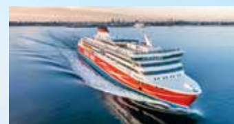
Tarttoon matkataan upealla Viking XPRS:llä, jossa nautitaan brunssi