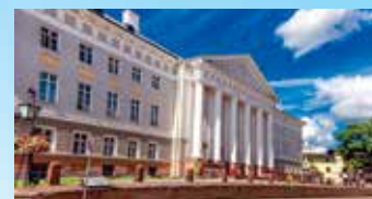
Viehättävä Tartto on yksi Baltian vanhimpia kaupunkeja