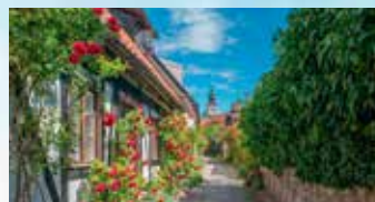
Visby on pieni, vehreä kaupunki, jossa riittää nähtävää kaikenikäisille