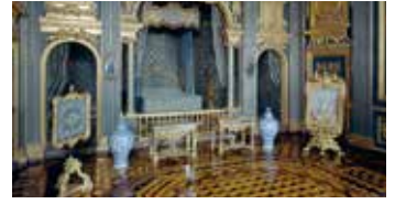
Vierailemme myös Drottningholmin linnassa.