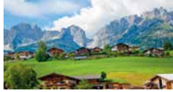
Lähde hyvinvointilomalle upeisiin Kitzbühelin maisemiin.