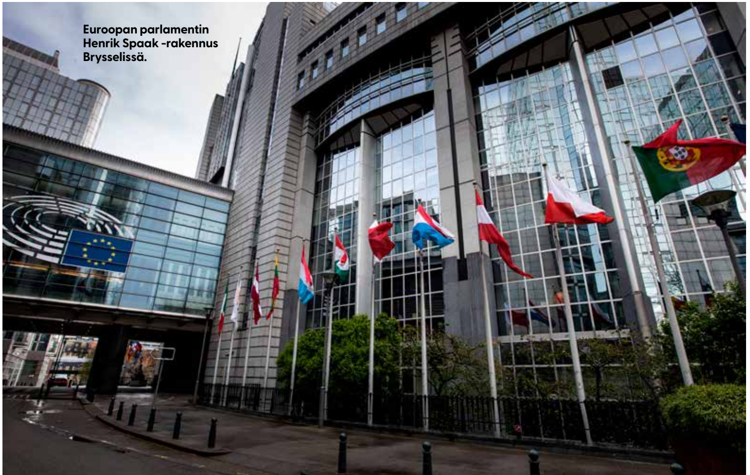
Euroopan parlamentin Henrik Spaak -rakennus Brysselissä.