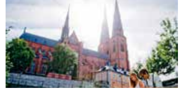
Uppsalan upea Tuomiokirkko.