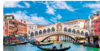
Matkalla tutustutaan myös tuhansien kanaalien Venetsiaan