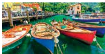
Tällä matkalla on runsaasti aikaa tutustua kauniin Gardajärven seutuun