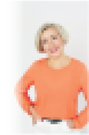
Seijorin-äiteiden Aikio-ohjelmassa on ollut mukana useita eri ikäisiä naisia, jotka ovat olleet mukana ohjelmassa.

– Ohjelmassa on ollut mukana useita eri ikäisiä naisia, jotka ovat olleet mukana ohjelmassa.