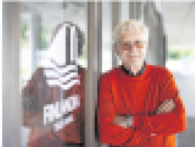
Seurajärjestö ry täyttää 50 vuotta vuonna 2025. Yhteisöllinen ja yhteistyö on keskeistä toiminnassa ja jäsenistöä kehoitetaan osallistumaan toimintaan. Seuran toiminta on suunniteltu jatkamaan jäsenistöä.